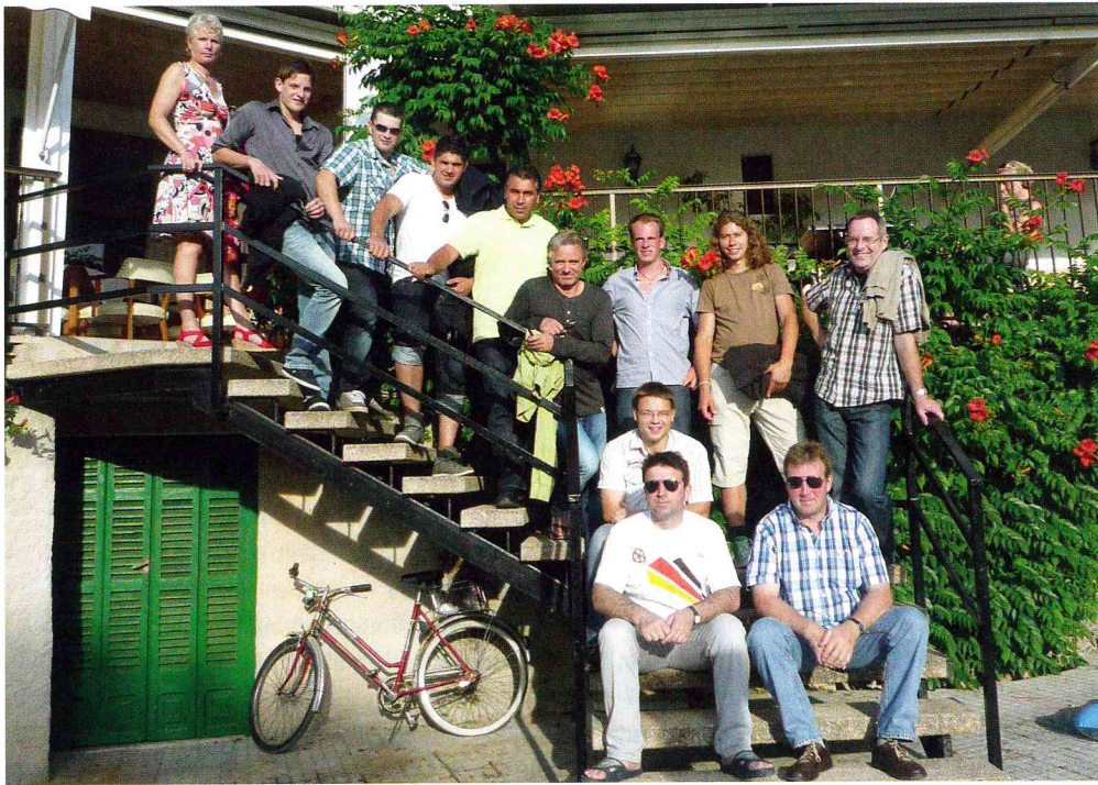
Ein Teil der „Mannschaft“ bei ihrem Betriebsausflug auf Mallorca.